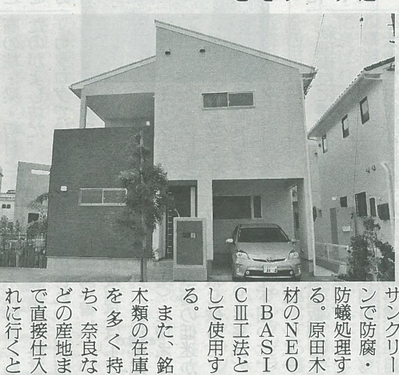
沖縄でこだわりの木造住宅を供給する

安心感を提供できると。こうした姿勢は、遮熱シート「リフレクテックス」の採用や、減震装置のオプション設定など、良いものを積極的に採用して使うことにも表れている。