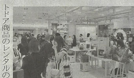
阪急百貨店は12日、阪急うめだ本店(大阪市)でサステナブル(持続可能)に関連する商品や体験を提供する新たな売り場「GREEN AGE(グリーンエイジ)」を開業する。

サステナ商品・体験、売り場開業 阪急百貨店は12日、阪急うめだ本店(大阪市)でサステナブル(持続可能)に関連する商品や体験を提供する新たな売り場「GREEN AGE(グリーンエイジ)」を開業する。 環境負荷が少ない建材やしっくいを使った床などを売り場に採用。消費者の環境意識の高まりに対応し新規の顧客獲得につなげる。 グリーンエイジは同本店の8階に設置する。売り場面積は約2300平方メートルで、「人と自然の共生」をコンセプトにアパレルや雑貨、高級ブランドなど約40店舗が入る。アウ