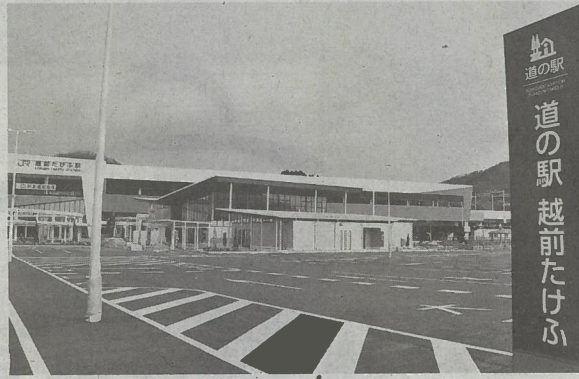
2024年春開業の北陸新幹線越前たけふ駅前...