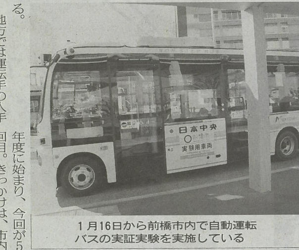
1月16日から前橋市内で自動運転バスの実証実験を実施している