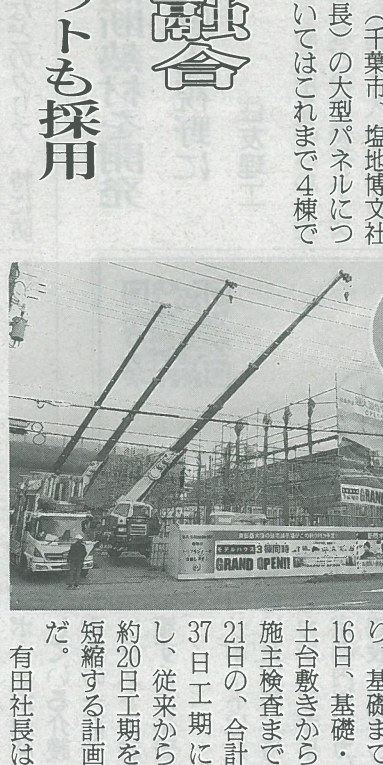
有田社長は「現在の試算では1棟 当たりのコストは若干 高くなるが、工期を短 縮して回転率を高める ことで、同じ施工体制 井鋼製野縁の採用、ユ ニット配線を採用したい」と考えてい

Standard(静岡) 採用し、改善、さらに 効率化できるよう開発 を進め、新本社展示場 3棟のモデルハウスで 様々な試験施工も行 った。