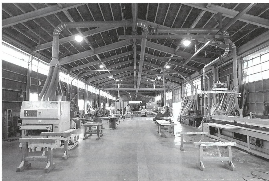
▲写真① 当社の製品加工工場 ここで木材を加工後、仕上げて納品する。

同業他社は、世界の一部地域や広葉樹と針葉樹の一部樹種などを専門的に扱っている場合がほとんどですが、当社は世界各国の木材や木製品を総合的に扱っています。木材の付加価値向上と職人手間を抑えるという現代のニーズに応えるべく、当社では木材・集成材加工工場の設備投資を続けています（写真①）。経験豊富な技術者の能力と3次元NCルータ（複雑な形状の加工が可能な加工機）、ランニングソー（木取り工程におけるサイズカット用の機械）、一面